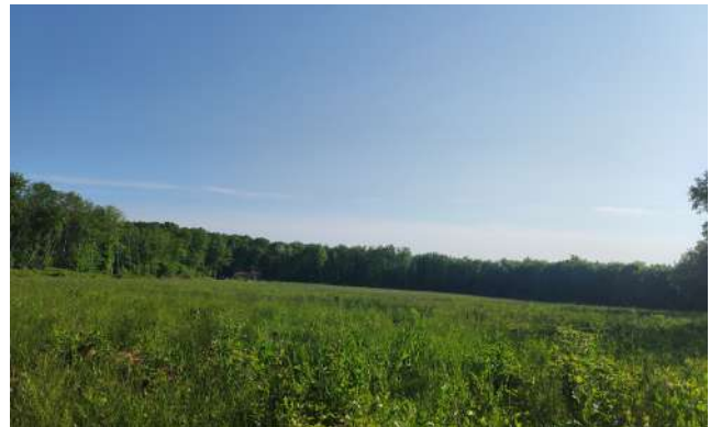
Parcelle 3 -Reboisement - Forêt de Merry (Yonne)

Une actualisation de l'expertise de la forêt est programmée en fin d'année, conformément à l'obligation réglementaire de réévaluation triennale.